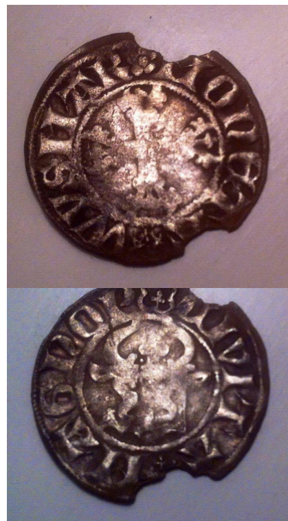
Picture 3 Billederne viser den tyske mønt fra Wismar med motivet af en tyr på den ene side og et kors på det andet. Fra slutningen af 1300-tallet.

Fra denne periode stammer også en seglstampe, som desværre ikke lod sin tidligere ejermand afsløre ved første øjekast, men som museet forhåbentlig finder frem til på et tidspunkt.