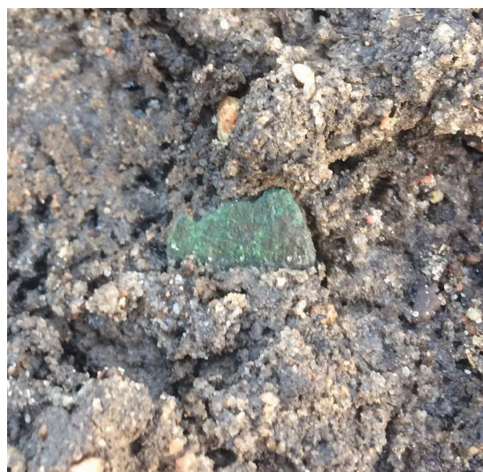
Picture 2 Borgerkrigsmønt, der endnu ikke er gravet fri af mulden. Nærmere typebestemmelse er qua dens tilstand tæt på umulig.

Når markerne endelig bliver høstet, åbnes der også her op for en sand guldgrube af interessante fund. Indtil videre tælles knap 100 fund, der er afleveret til Odense bys museer. En væsentlig andel af disse udgøres af såkaldte "borgerkrigsmønter"- mønter fra perioden 1241-1377. Disse mønter er som det ses på billedet i utrolig dårlig stand, og man skal næsten vide, hvordan de ser ud, for at de ikke ryger ud som skrald. Med deres iøjefaldende antal betegnes de nu som en skat, og vidner om den historie, som omgiver det nærliggende voldsted. Disse mange borgerkrigsmønter blev ledsaget af et par engelske sølvmønter fra samme periode; såkaldte "longcross". I samme område er der udover skatten også fundet en hel del fragmenter fra en