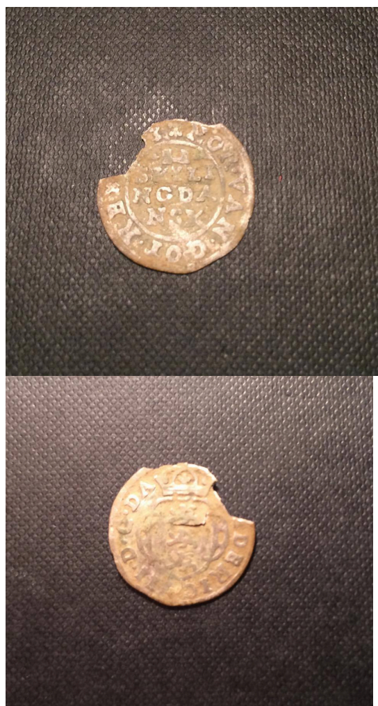
Picture 1 Billederne er for- og bagside af den mønt fra 1660erne, som blev fundet på folden bag slottet. Hvis de er af for dårlig kvalitet kan jeg godt prøve at tage nogle nye, ellers kan det være Jacob har nogle fra den dag vi tog billeder af nogle af fundene.

resultat af lemfældigt brug af spaden under søgen efter signalet). En gennemgang af diverse møntkataloger, hvor de finere detaljer i våbenskjoldet blev sammenlignet, skulle vise sig at afsløre mønten som værende en 2 skilling fra 1660erne af daværende konge, Frederik III. Dog havde den en vægt på kun 0,56gram; blot halvdelen af vægten af lignende mønter fra samme periode. Lægger vi en smule oven i det, da der jo manglede en lille del (dog ikke mere end tiendedel) kan vi med lidt god vil-